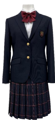
II 型スカート スタイル