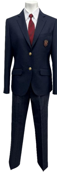
II 型スラックス スタイル