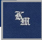
ポロシャツ(夏服) ※白と紺から選択できます