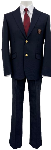
I 型スラックス スタイル