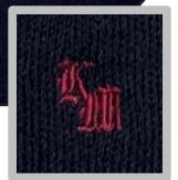
ニットカーディガン