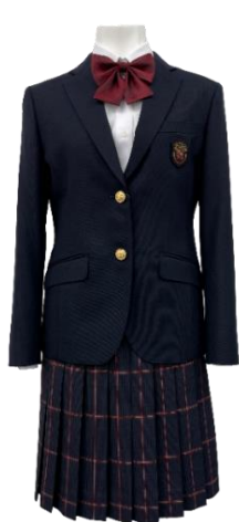
II型スカート スタイル