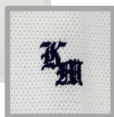
ポロシャツ(夏服) ※白と紺から選択できます