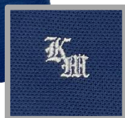
ポロシャツ(夏服) ※白と紺から選択できます