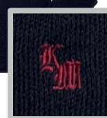
ニットカーディガン

令和5年度入学生から制服が変わります。下の服装規定に従って、指定販売店にて購入してください。